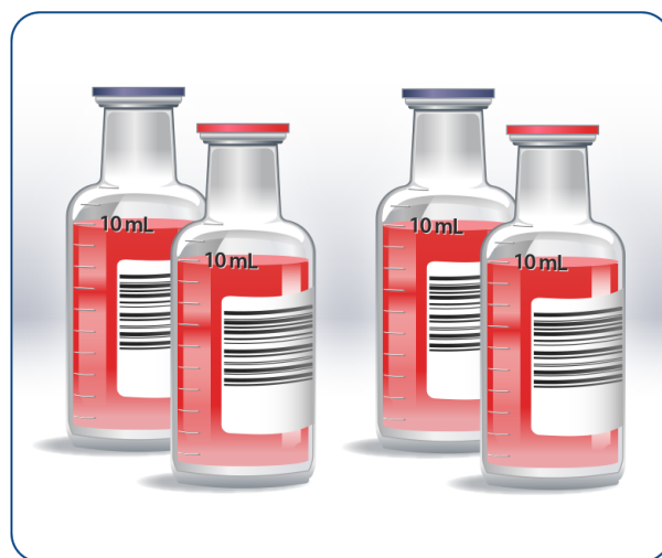
Representación de dos muestras de sangre para cultivo, una frasco aeróbica y una frasco anaeróbica en cada muestra, mostrando los 10 mL de sangre recolectados en cada frasco para un volumen total de 40 mL.