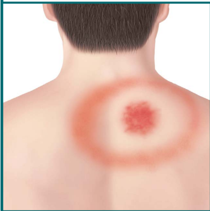
Erupção cutânea tipo "olho-de-boi" nas costas.