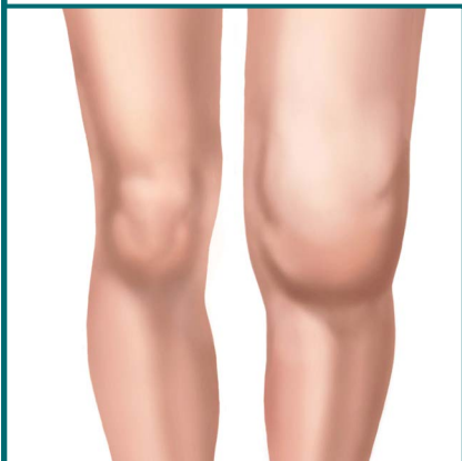
Joelho com artrite.