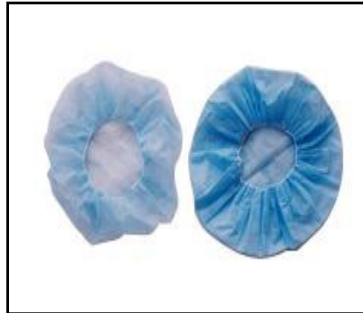
Cabeza + pelo