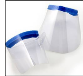
Ojos + nariz + boca