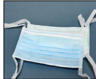
Nariz + boca